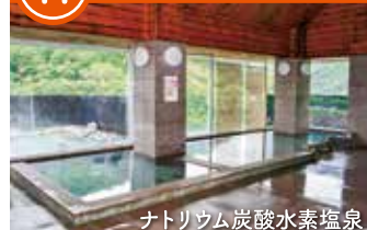
ナトリウム炭酸水素塩泉