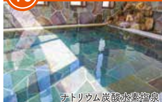
ナトリウム炭酸水素塩泉