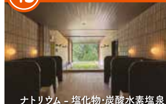
ナトリウム - 塩化物・炭酸水素塩泉