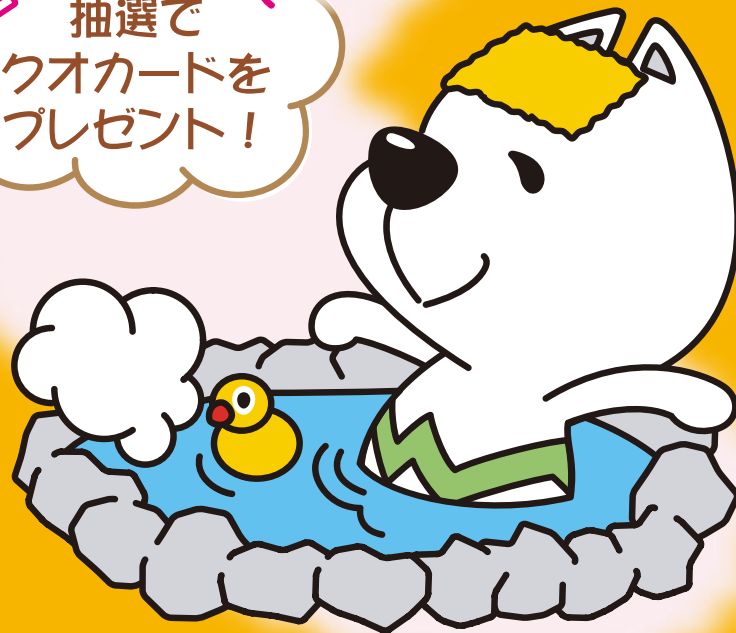
和歌山県PRキャラクター かいちゃん