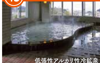
低張性アルカリ性冷鉱泉