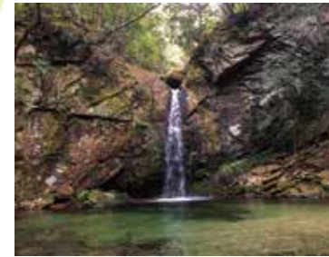
日置川県立自然公園の 百間山渓谷

和歌山県には、吉野熊野・瀬戸内海の2つの国立公園、金剛生駒紀泉・高野龍神の2つの国定公園、白崎海岸や大塔山等の12の県立自然公園があり、それぞれが特徴のあるすばらしい自然景観を有しています。