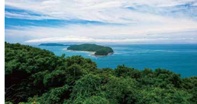
瀬戸内海国立公園 加太