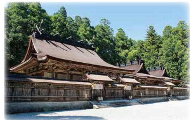
熊野本宮大社

田辺市本宮町川湯13 ☎0735-42-1011 営業 14:00～19:00(日帰り) 大人800円、小人400円 P70台 熊野の大自然をご堪能頂ける温泉です。肌に変優しく湯冷めしにくく、疲れを癒してくれます。日帰り入浴についてはご入浴時間の変更又は入浴をおことわりする場合があります。