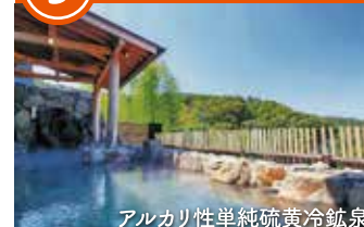
アルカリ性単純硫酸冷鉱泉