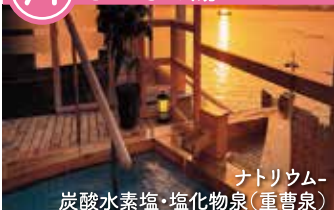
ナトリウム炭酸水素塩・塩化物泉(重曹泉)