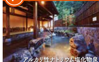
アルカリ性ナトリウム塩化物泉